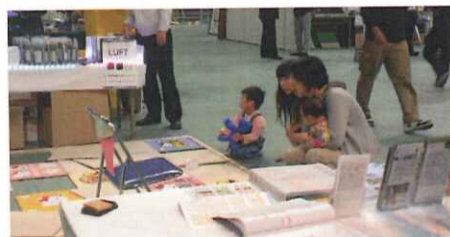
注目！？人気キャラのタイルカーペット