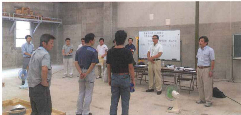
本試験直前、真剣な表情で内容説明を聞く受験者(手前側)

本年の受験は床検定2名、木質系7名。猛暑に見舞われたこの日、緊張の中にも、日頃の研鑽を発揮しながら、受験者達は課題に取り組んだ。