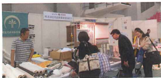
青年部も活躍してます(写真上、右)

また、(有)つぼみ内装工業、(株)広島、賛助会員の提供により、今年もカーテンハギレとタイルカーペットの販売を行い、2日間で売り切った。